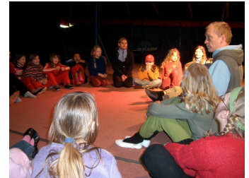
Besprechung in der Manege

Weitere Beispiele für angewandte Partizipation im Kinder- und Jugendzirkus können die individuelle Auswahl der zu übenden Zirkusdisziplinen, die Anschaffung von neuen Requisiten oder die Entwicklung einer Zirkusvorstellung sein. Hier kann gemeinsam ein Thema für die Show gesucht werden oder ein Handlungsstrang eines Zirkustheaters mit Impulsen aller Mitwirkenden erarbeitet werden. Das kann sich bis hin zur Beteiligung an Entscheidungsprozessen auf Vorstandsebene in einem Verein erstrecken.