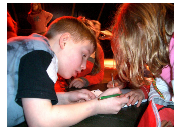
Planung einer Zirkusnummer

Ein qualitatives, zirkuspädagogisches Training beinhaltet all diese Komponenten. Beim Aufbau von Nummern oder einer ganzen Show ist immer wieder Kreativität gefragt, um Ideen für eine ansprechende Präsentation des Könnens zu entwickeln. Bei der Erarbeitung von Trickreihenfolgen ist eine Problemlösungsfähigkeit gefordert. Es muss durchdacht - oder auch ausprobiert - werden, wie man von einem Trick zum Nächsten kommt, wie man einen Übergang schafft. Hilfestellungen erfordern hohe Aufmerksamkeit, Sicherheitsmaßnahmen müssen begriffen und umgesetzt werden. Durch gegenseitiges Präsentieren und Beobachten der Arbeitsergebnisse wird eine ästhetische Wahrnehmung angeregt. Durch viele Bewegungsabläufe werden Auswirkungen physikalischer Kräfte (Flieh-, Schwerkraft, Hebel) erfahrbar und somit leichter verinnerlicht. Eine Reflexion der eigenen Lernprozesse sowie die damit verbundene realistische Einschätzung des eigenen Könnens sollten im Training immer wieder angeregt werden. Daraus kann bei den erfahreneren Kindern und Jugendlichen eine individuelle Planung und Zielstrebigkeit des eigenen Trainings sowie Selbständigkeit bis hin zur Selbstorganisation resultieren.